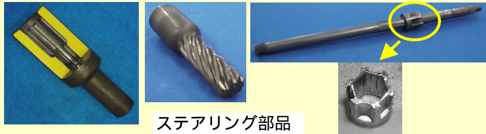
ステアリング部品