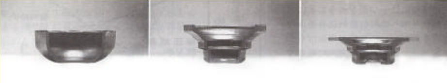
複動成形技術を用いた圧縮絞り主体の成形工程