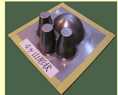
インクリメンタル成形品