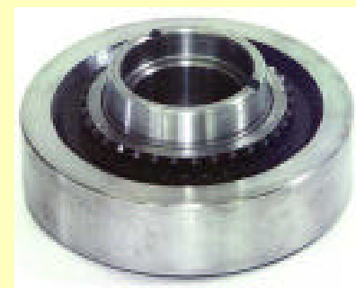
モノブロック沈みタイプ