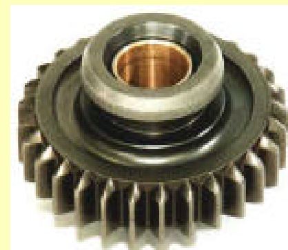
リバースアイドル