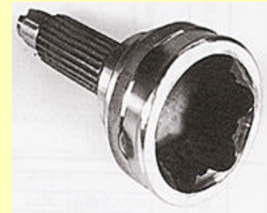
BJマウス冷鍛外輪 BJ Outer Race with Cold Forged Inside

業務内容 高品質・高能率・環境負荷低減を目標に、主要商品及び新商品の製造技術について塑性加工から生産システムまで一貫した研究開発を担当。