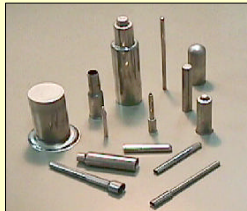
深絞り製品 特殊形状