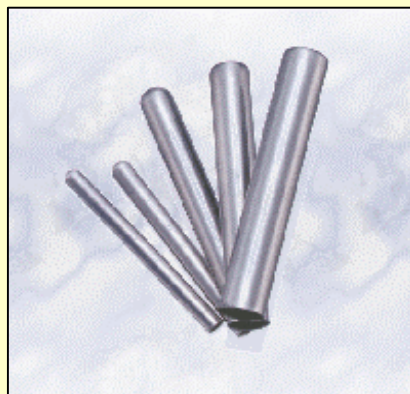
深絞り製品 規格品

材質SUS304L、板厚t0.25・t0.3・t0.4・t0.5mm 外径 3.5～20mm、全長20～55mm 標準寸法内であればご要望のサイズにピッタリ合わせ ます。