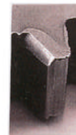
(a) 製品外観 (b) チャンファ部拡大 リングギヤー体ドライブプレート