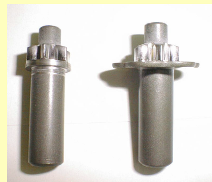
2 自動車制動系部品の成形加工品