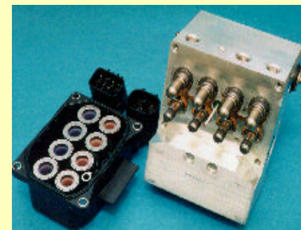
量産化に成功した小型電磁弁