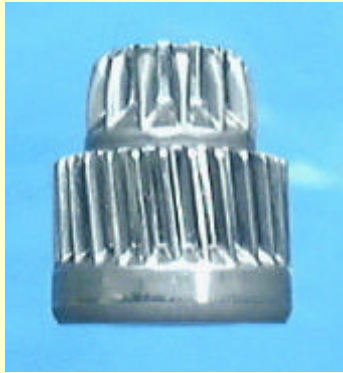
フォーマによるギア部品の成形事例