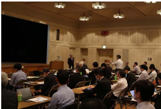
写真3 研究班集会（鍛造技術温故知新研究班）