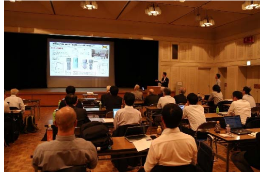
写真2 研究班集会（鍛造知能化研究班）