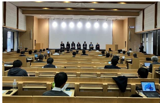
写真8 総合討論の様子