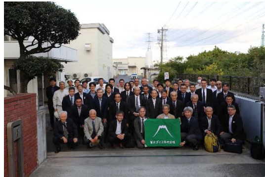
写真6 工場見学（富士ダイス(株)）