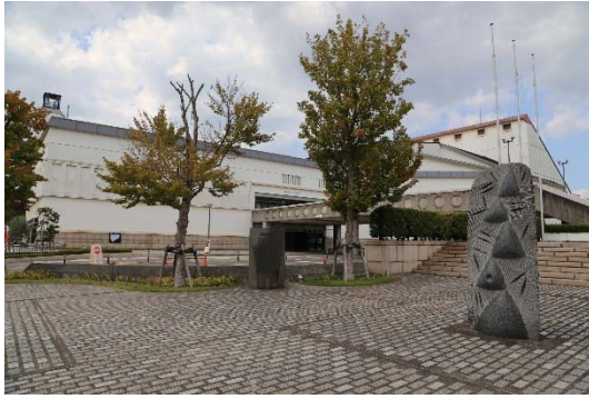
写真1 倉敷市民会館