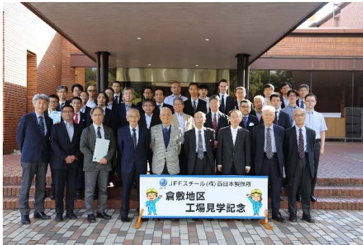
写真5 工場見学（JFE スチール(株)）